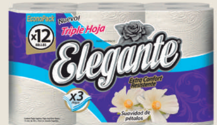
Código 957 4 x 12 x 20m c/u 4 bultos x 10 camadas