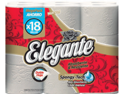
Código 918 4 x 18 x 20m c/u 4 bultos x 7 camadas