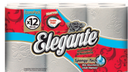
Código 917 4 x 12 x 20m c/u 4 bultos x 10 camadas