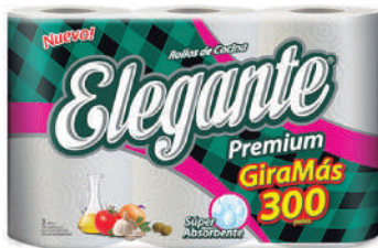
Código 930 5 x 3 x 100 paños 5 bultos x 10 camadas