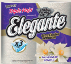
Código 955 10 x 4 x 20m c/u 5 bultos x 10 camadas