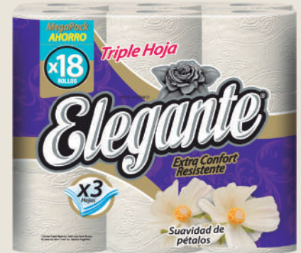
Código 958 4 x 18 x 20m c/u 4 bultos x 7 camadas