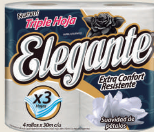
Código 950 6 x 4 rollos x 30m c/u 6 bultos x 10 camadas