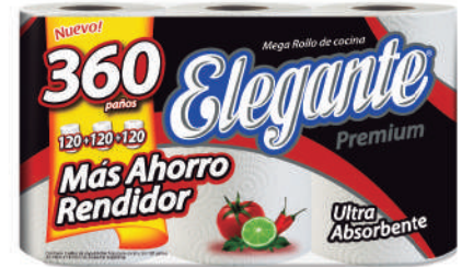
Código 923 Mega Rollo 4 x 3 x 120 paños 6 bultos x 11 camadas