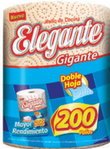
Código 920 Gigante Decorado 8 x 1 x 200 paños 6 bultos x 10 camadas