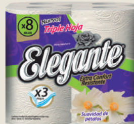
Código 956 6 x 8 x 20m c/u 4 bultos x 10 camadas