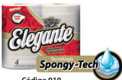
Código 910 10 x 4 x 20m c/u 5 bultos x 10 camadas