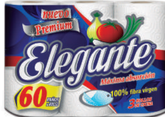
Código 928 8 x 3 x 60 paños 5 bultos x 10 camadas