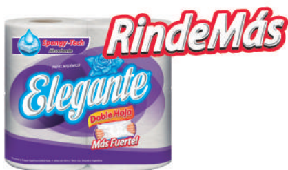
Código 913 10 x 4 x 30m c/u 4 bultos x 10 camadas