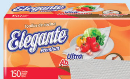
Código 996 Toallas de cocina Intercaladas DH 21cm x 20cm 15 x 150 Toallas 7793344019960