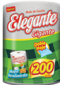
Código 921 Gigante 8 x 1 x 200 paños 6 bultos x 10 camadas