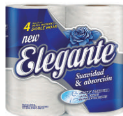
Código 915 10 x 4 x 30m c/u 5 bultos x 10 camadas