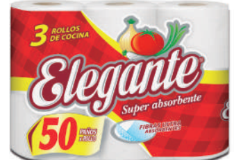
Código 927 8 x 3 x 50 paños 5 bultos x 10 camadas