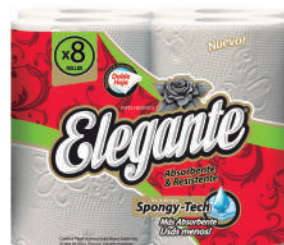
Código 911 6 x 8 x 20m c/u 4 bultos x 10 camadas