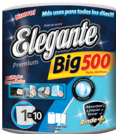
Código 924 Big 500 6 x 1 x 500 paños 5 bultos x 10 camadas